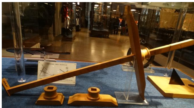
Figura 2 - Vara e soalhas